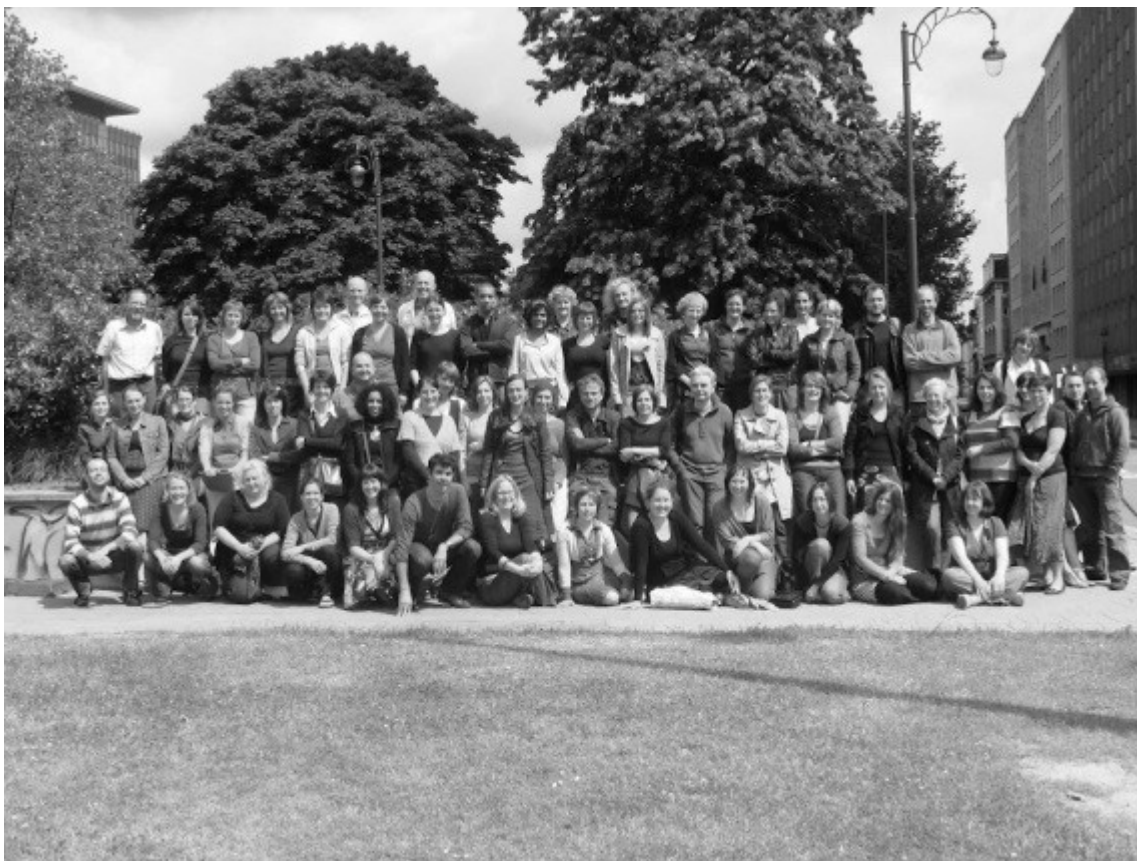
Bijna alle lesgeefsters en lesgevers van Brusselleer...